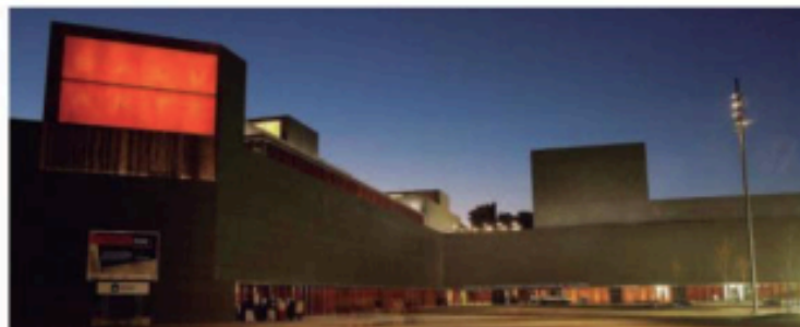
Vista del Palacio de Congresos y Auditorio de Navarra Baluarte