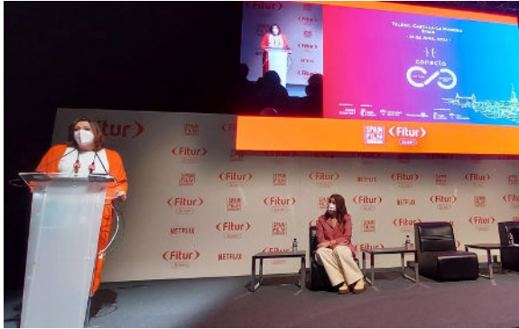
Conecta Fiction & Entertainment se presentó desde Toledo